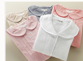
オリジナルのパジャマ