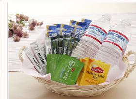
コーヒー紅茶、水セット